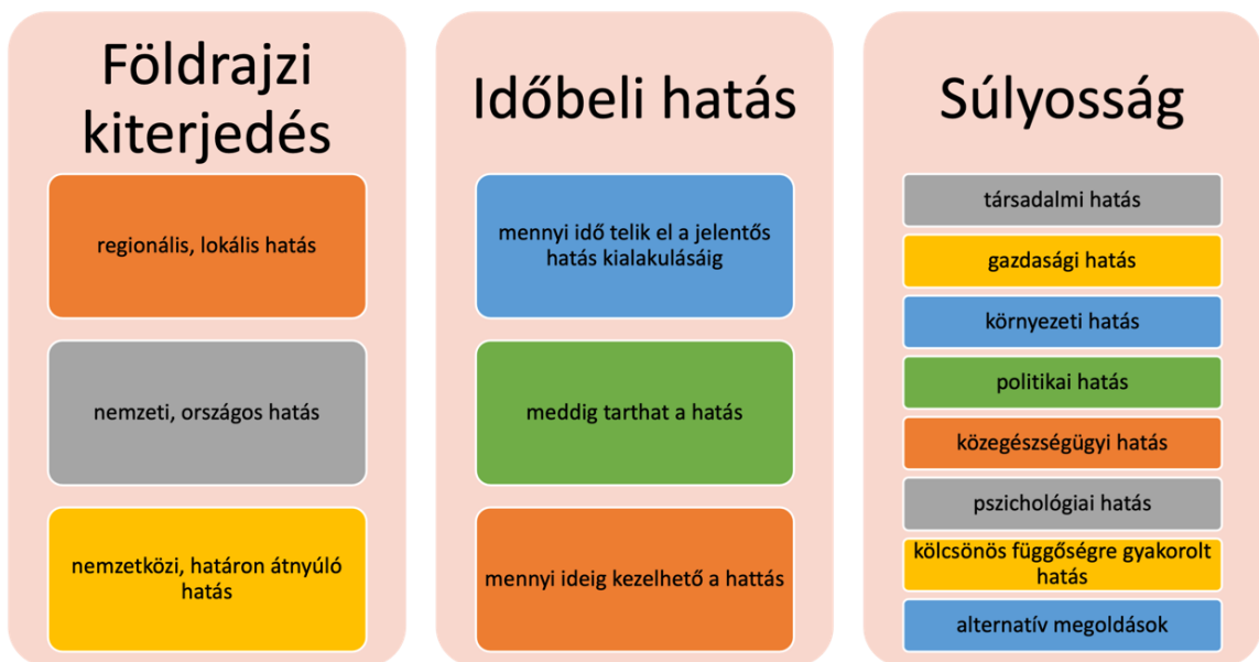
1. ábra: Következmény alapú kritikusság három kategóriája, a szerző saját szerkesztése

A súlyosság mértékének megállapításához figyelembe kell venni a társadalomra, a gazdaságra, a környezetre, a politikára, a közegészségügyre, a pszichológiára és a kölcsönös függőségre gyakorolt hatását, valamint vizsgálni szükséges a KI alternatív lehetőségeit.