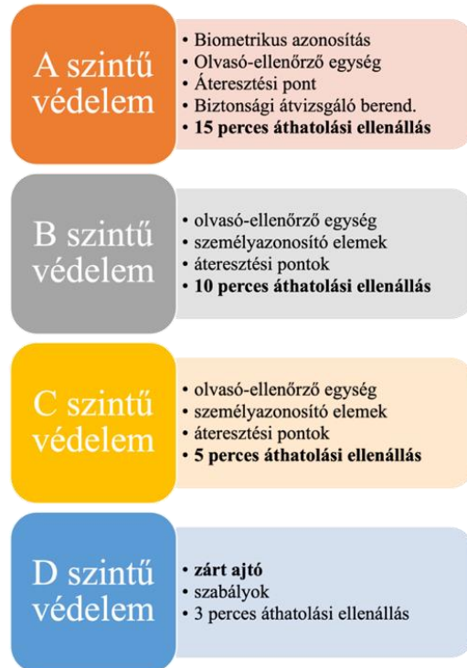
5. ábra Védelmi kategóriák összehasonlítása, a szerző saját szerkesztése

A magyar jogrendszerben további mélyebb kutatást folytattam, a hivatalos rendeletek és törvények mellett más forrásokat is áttekintettem. Meglepő módon csak egyetlen további helyen talákoztam a beléptető rendszerrel szembeni követelmények meghatározásával, mégpedig a 8/2021. (XI. 18.) OBH 39 utasítás a bírósági épületek fizikai védelmi rendszereinek feltételeiről címmel megjelent utasításának III. fejezetének 6. pontjában. Azonban beléptető rendszerekkel szembeni követelmények biztonságsszakmailag hiányosan kerültek megfogalmazásra. [125]