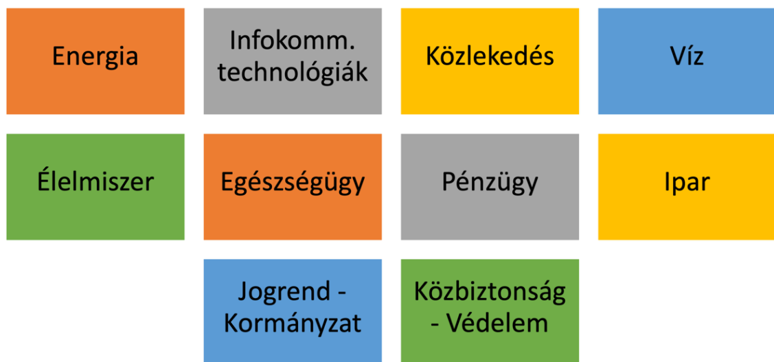
2. ábra: A KI-k ágazatai a 2080/2008. Korm. rendelet alapján, a szerző saját szerkesztése

Meghatározásra kerültek a KI-t veszélyeztető tényezők köre 12 , amelyeket három fő csoportba bonthatók: